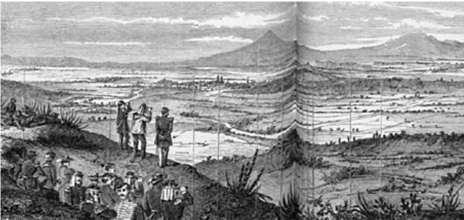
Panorama de la plaine de Puebla

Un an plus tard, le 8 mai 1863, Allain LE STUM était devant Puebla.