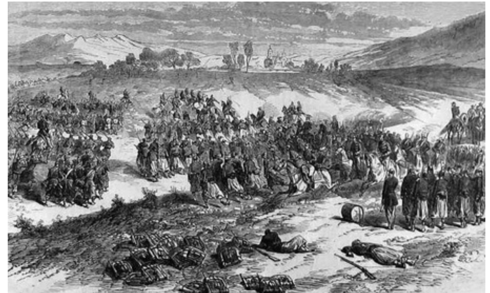
Bataille de San Lorenzo